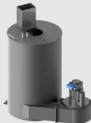
Codice 80-1003 camino basso