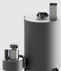
Codice 80-1001 camino alto Codice 80-1002 camino basso