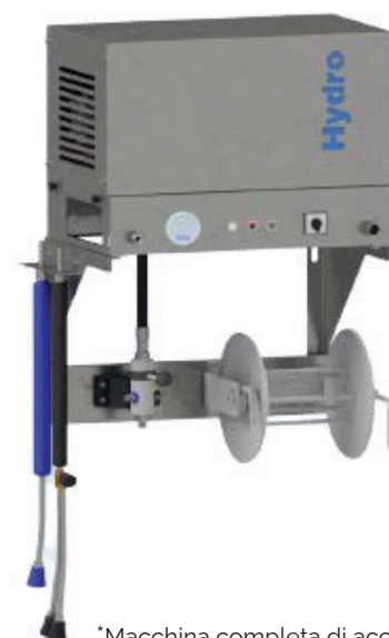
*Macchina completa di accessori