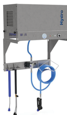
Con staffa e sella portatubo