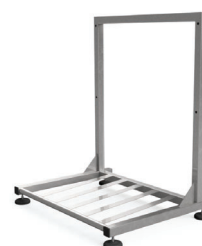
Kit pavimento Serie P cod. CBX12002 Serie S cod. CBX12004 Serie T cod. CBX12005