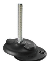
Piedini al posto delle staffe Cod. 80-2011