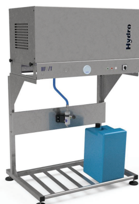
Con kit pavimento