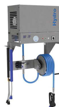
Con staffa e avv. manuale