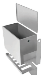
Vasca by-pass esterna (Serie T) Cod. 80-2031