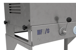
Iniettore montato su telaio per Serie S e T Iniettore un prodotto: 80-2023 Iniettore due prodotti: 80-2024