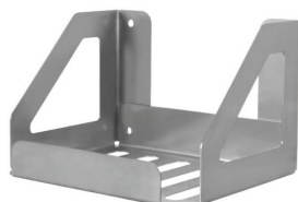
Portataniche 10 lt cod. 105000001 25 lt cod. 105000002